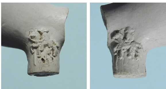
Afb. 5a-b. Ovaal model, hielmerk vijf schijven en zijmerk ruiter te paard.