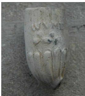
Afb. 2. Knorrenpijp met twee klaverbladen waarboven WVMF.