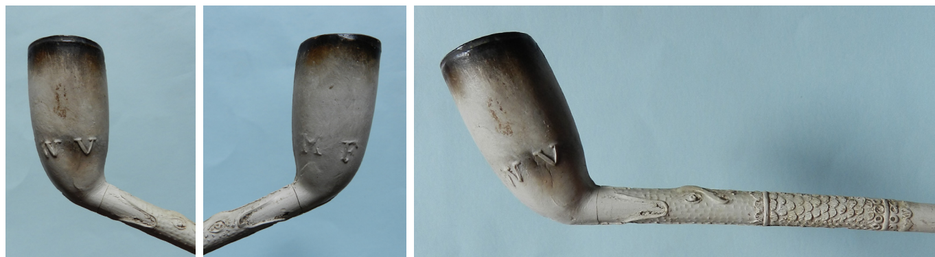
Afb. 1a-c. Rondbodem model met vissenkop en de letters WVMF. (Collectie Steven van Haaren)

Het merendeel van de aan de Lange Geer gevonden pijpen is afkomstig uit Gouda en heeft een ovaal model dat te dateren is in de periode 1735-1745. Deze pijpen zijn gemerkt met de vijf schijven of cinq (13 exemplaren) en WS gekroond (1 ex.). Een tweetal pijpen gemerkt trekpot dateert van wat later datum, uit de periode 1740-1760. Van de pijpen met de vijf schijven heeft slechts één exemplaar een Gouds wapenschild op de zijkant van de hiel. Deze pijpen worden beschouwd als zijnde van de beste 'porceleijne' kwaliteit. De pijpen gemerkt trekpot hebben beiden een Gouds wapenschild met erboven een 'S' als teken dat het om de iets mindere 'fijne' kwaliteit gaat en kunnen daarmee na 1740 worden gedateerd.