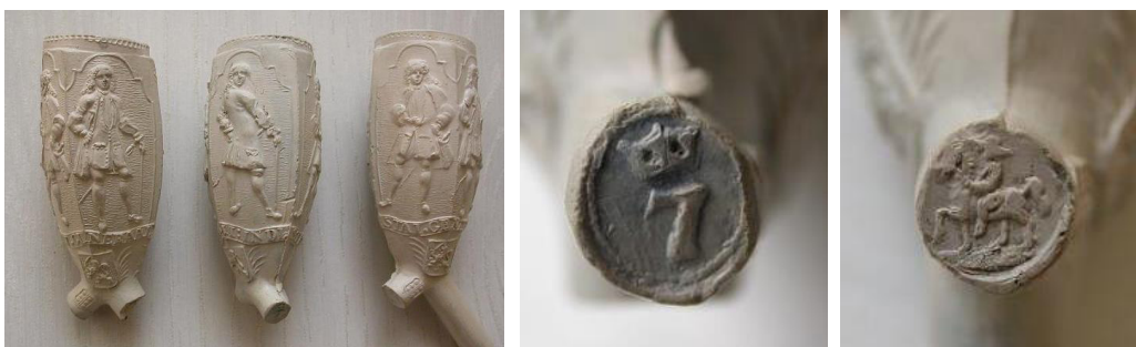
Afb. 6a-c. Ovaal model met gecommiteerde in de Staten Generaal, hielmerken 7 gekroond en ruiter te paard. Gouda, Willem Brammert[?]. (collectie en foto's Freek Mayenberg)